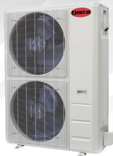
Modèle illustré : DIRM-48HXPRO28-5Z